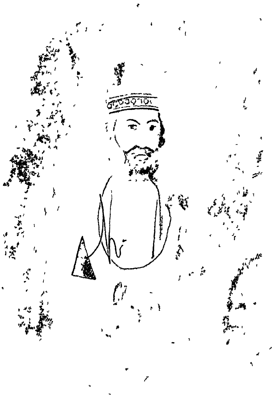
पण्डित गंगाधर नेहरू ( जवाहरलालजी के दादा )